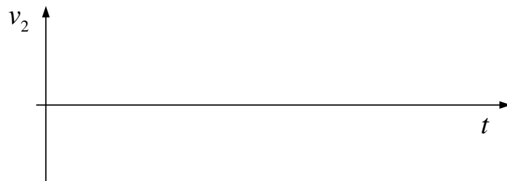
Figura 2 – Formas de onda observadas no osciloscópio.